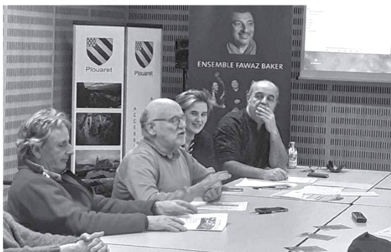
Membres du bureau et bénévoles réunis à la mairie pour faire le bilan de l'année écoulée.

« Nous avons défini un périmètre de 23 km autour de Plouaret. Il s'agit de quatre rendez-vous autour des solstices et des équinoxes sur l'improvisation, à chaque fois dans un lieu différent,