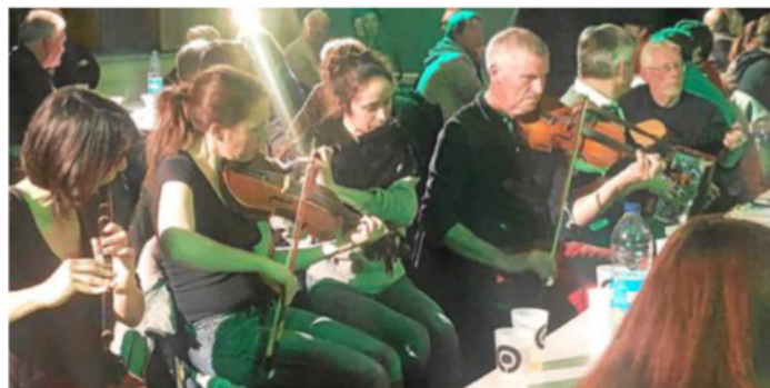
La Saint-Patrick a été fêtée comme jamais.