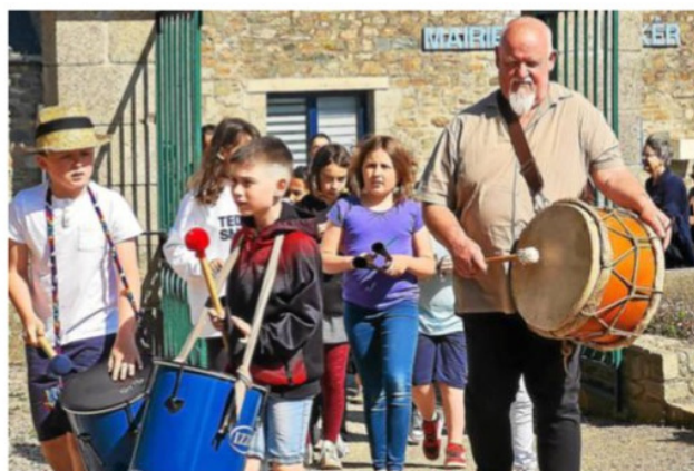
La déambulation a mené le public vers l'église Saint-Maudez.

et Hopi et leur musique en classe. Au fil des séances, nous avons fabriqué des carillons, d'étranges clarinettes et des percussions. Laissez-vous surprendre par ces expérimentations sonores, nous allons vous guider vers l'église, où se déroulera leur concert », ont annoncé les élèves.