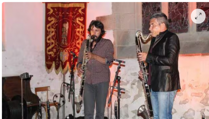
Le duo Cabaret Rocher se produira devant le public, en studio d'enregistrement, lundi 29 mai.

Le Studio Le Rocher, basé à Mohon (Morbihan) confirme son soutien aux musiciens. Son association récente avec le collectif de labels bretons Labels BizZzH en fait aussi un acteur naissant de la protection du disque. Les Studios de Bretagne (LSDB), un studio d'enregistrement analogique et numérique établi à Ploërmel , propose un soutien concret à ces ambitions déclarées en faveur de la musique et du disque, qu'il soit vinyle ou CD.