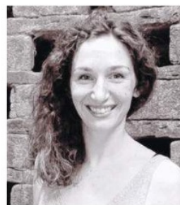
Camille Le Jeune Production

« Brise », performance artistique et sensorielle à bord d'une caravane-théâtre, se déroulera sur la place du Dresnay. À 17 h, retour à la terre avec