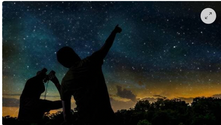
Pour la compagnie Hirustica, le solstice d'été sera propice à vivre une soirée artistique, dans la campagne.

Ouest-France Publié le 07/06/2023 à 14h37