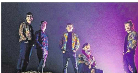
Le groupe ModkozmiK