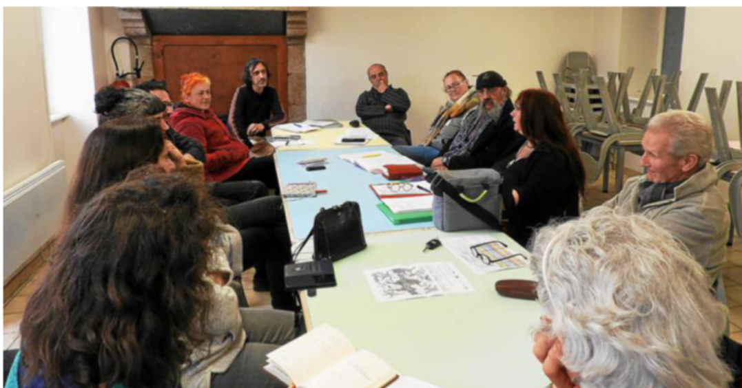
Le programme de « Rivières aériennes » se dévoile.