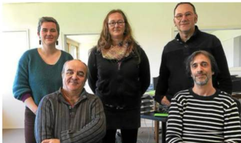
Les compagnies Via Cane et Hirundo Rustica renouvellent les Rivières aériennes avec pour décor Le Vieux-Marché, le Léguer et le Saint Ethurien.

Les rivières aériennes à Vieux-Marché, le 15 juin à partir de 11 h, place du marché et le 16 juin, à partir de 10 h 30, au bord du plan d'eau. Programme sur hirustica.fr/les-rivieres-aeriennes