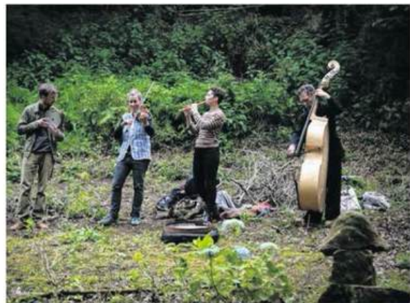
Le site de Kerbiquet a participé à rendre le concert final absolument magique.