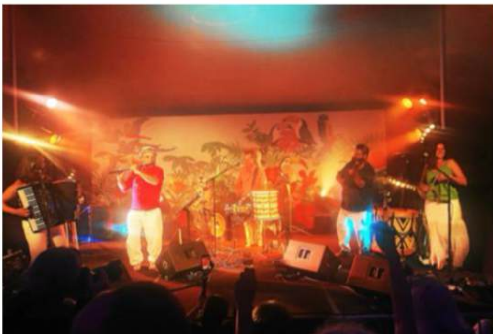
Près d'un millier de personnes sont venues passer la soirée.