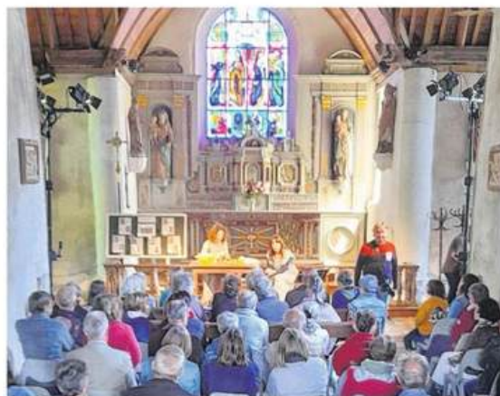
Photo de l'édition « Mémoires », à la chapelle des 7 Saints, en Vieux-Marché.

Dimanche 16 juin, Les « marins d'eau douce » restitueront à 10 h 30 les travaux des éco-