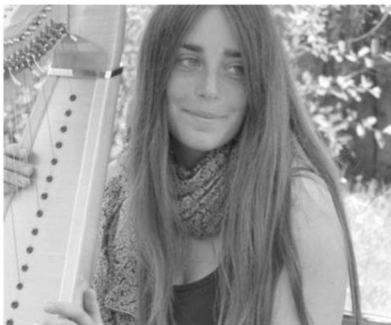
Maëlle Vallet DR

TRÉDREZ. « Hanter Noz » s'invite au Théodore ! Fêtons le solstice d'hiver avec un nouvel épisode de « Hanter Noz », rendez-vous artistique itinérant et improvisé co-organisé par la Compagnie Hirundo Rustica et l'association Tohu Bohu. Mêlant les disciplines – musique, théâtre, danse ou arts visuels, ces itinérances improvisées « Hanter Noz » explorent un lieu chaque fois différent et mettent face à