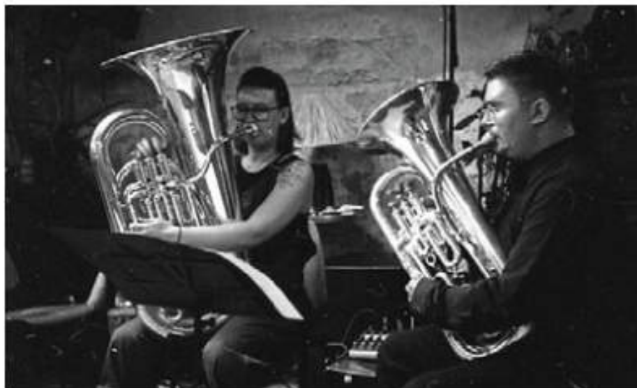
Le duo de cuivres écossais Dopey Monkey se produira en concert, dimanche, à la menuiserie Le Goff.