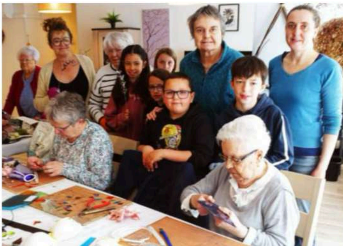
Les enfants du centre de loisirs et les colocataires de la maison partagée Âges & vie ont participé à un atelier vitrail.

Les Rivières aériennes, un événement multiculturel qui relie les habitants du Trégor rural, se dérouleront à Ploubezre les 17 et 18 mai, avec des ateliers, une exposition, une veillée ou balade autour du thème « Main(s) ». À cette occasion, les habitants de la commune exprimeront leur savoir-faire en présentant leurs œuvres devant le public.