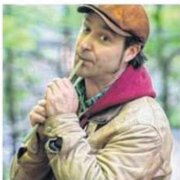
Erwann Lhermenier DR

En écho à l'exposition « la nature elle-même » et à la démarche artistique de l'artiste Herman De Vries, une performance aura lieu dimanche