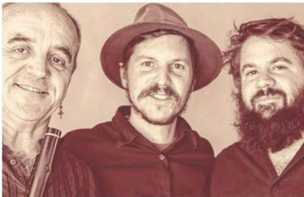
Baleer Bro.

MORLAIX. Créé pour les deux cents ans de la naissance de François-Marie Luzel à Plouaret, le trio Baleer Bro propose une lecture contemporaine des récits collectés par le poète dans le Trégor rural du XIX e siècle. Le Baleer Bro, « marcheur de pays », colporteur ou mendiant, allait de village en village et offrait à ses hôtes une chanson, un conte ou un dessin, en échange du logis et du couvert.