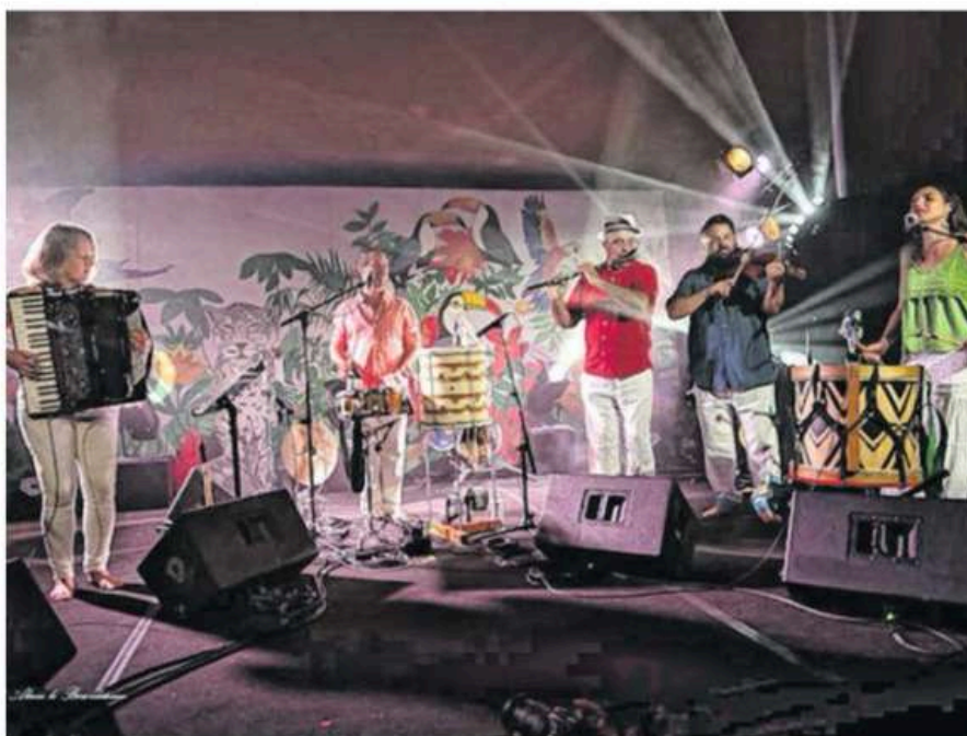
Nordestinoz jouera pour marquer cette rencontre entre Brésil et Bretagne

Au fil du temps, des productions de spectacle vivant se sont montées, des disques ont été édités, des réseaux se sont