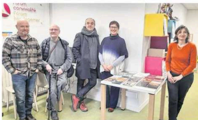
Artistes de la compagnie, élus et responsable de la médiathèque autour des CD offerts par Hirundo Rustica.