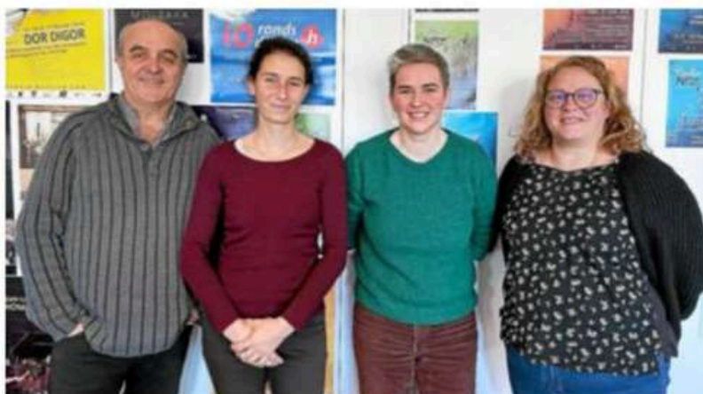
La compagnie Hirundo Rustica et le comité des fêtes s'associent pour organiser un grand bal brésilien et breton à l'occasion de la Fête de la musique.

Grand bal, le 20 juin, à la salle des fêtes. Gratuit. Repas sur réservation uniquement.