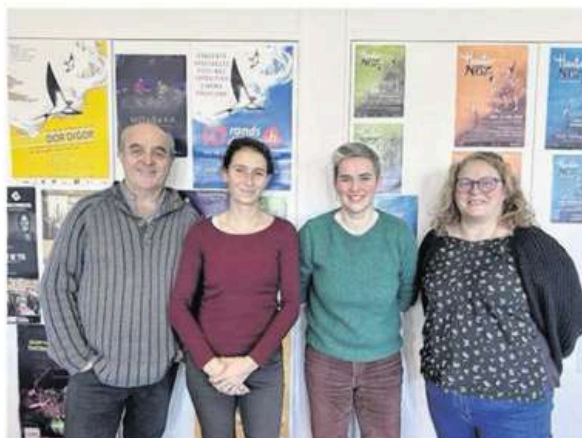
Le comité des fêtes et la compagnie Hirundo Rustica unissent leurs talents pour la fête de la musique, en juin.

Au programme, une ambiance chaleureuse et métissée, avec la fanfare Pifes da Bretanha, les incontournables Frères Cornic qui célèbrent 30 ans de scène, le bal breton-brésilien enflammé NordestiNoz, sans oublier DJ Sandro et une démonstration de capoeira par Angoleiros Do Mar Trégor.