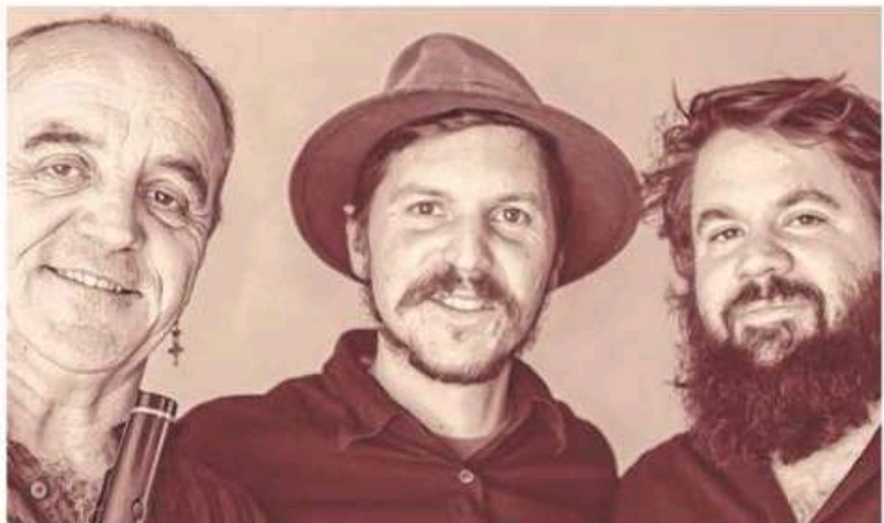
Baleer Bro.