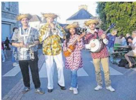
Bola de amigos.

Initiation à la danse bretonne. A 19h45 quai d'Aiguillon.