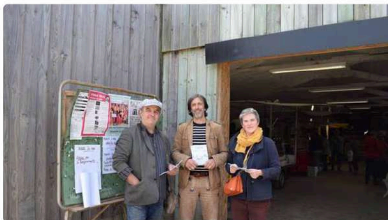
Expos, rencontres, visites, veillées... Les Rivières aériennes ont un programme bien chargé.

Du 15 au 17 mai 2025, à Ploubezre (Côtes-d'Armor), l'évènement multiculturel et intergénérationnel des Rivières aériennes revient pour sa troisième édition.