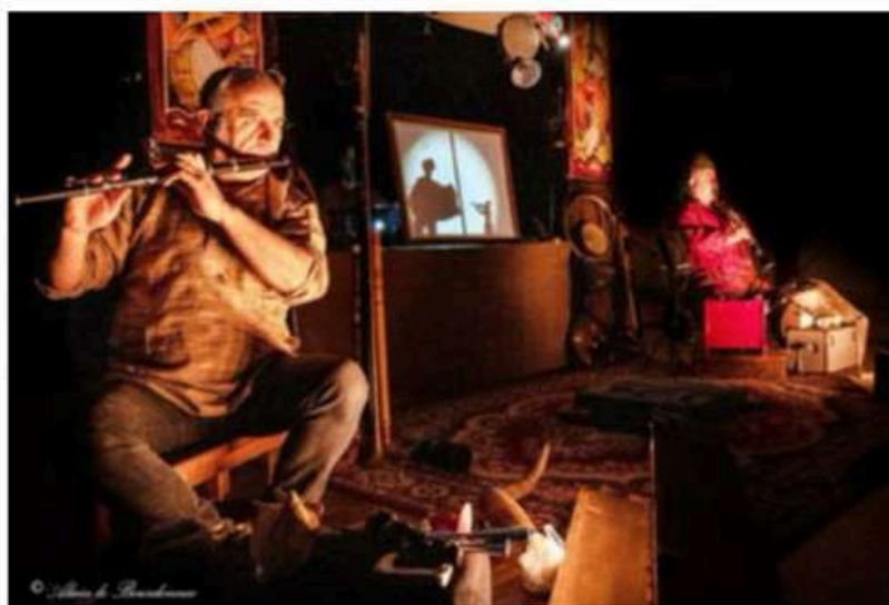
La petite boutique des notes perdues, un spectacle à regarder et à écouter, à partir de 6 ans. Alain Le Bourdonnec

visuelle et auditive. La première du spectacle a eu lieu ce jeudi à guichets fermés au Théâtre du Châtelet à Paris.