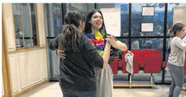
Du forró au programme de la fête de la musique, à Plouaret. HR

tuits sont proposés pour s'initier. Le premier, le samedi 7 juin, à la salle Ti Jean Foucat, de 14 h 30 à 16 h 30, sera animé par Babeth (Élisabeth Bodéré), qui enseigne les danses bretonnes à Vieux-Marché. Au programme : les bases de l'an dro et du hanter-dro, accessibles à tous. Le second, le 15 juin, au même