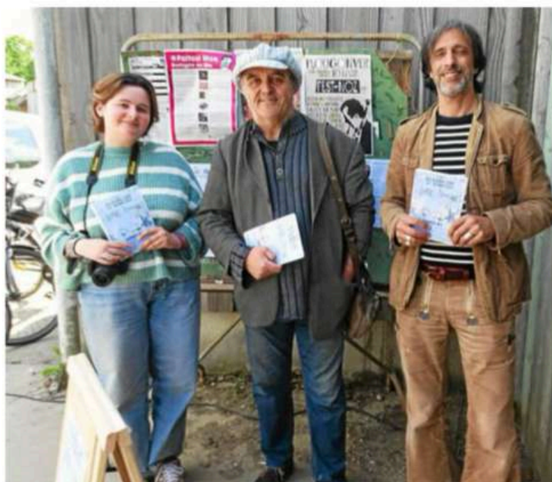
Les membres de Via Cane et Hirundo Rustica proposent, samedi et dimanche, sur la commune de Ploubezre des événements multiculturels : des balades, des expos, des rencontres, des visites, des veillées et des performances.