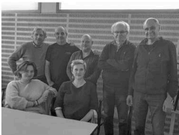
La Compagnie artistique donne rendez-vous aux Plouaretais le 20 juin.

L'année 2024 a vu naître pas moins de quatre nouvelles créa-