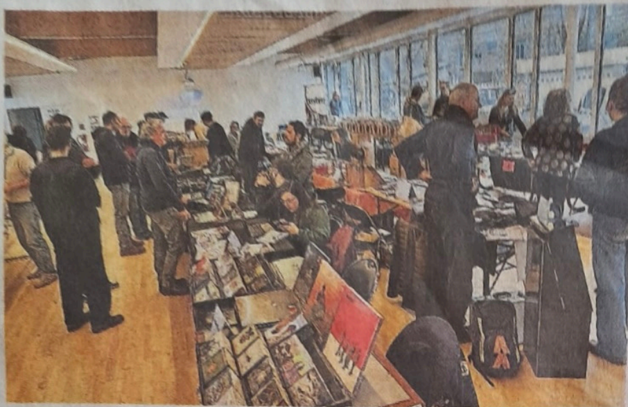
Les allées bien achalandées du marché du disque.

C'était un événement important, pour la commune, samedi, d'accueillir le Marché intercommunal du disque et des musiques enregistrées (Mideme), réunissant dix-sept labels discographiques ayant tous pour objectif de promouvoir les artistes et la création musicale. La salle Christian-Le-Fustec, dans l'espace Ti-Jean-Foucat, décorée de tapis dans un esprit de studio d'enregistrement, exposait des tables où s'alignaient les bacs remplis de vinyles, vintage ou récents. Vingt exposants, labels discographiques ou disquaires, majoritairement de Bretagne, ont ainsi pu faire découvrir leur travail et leur engagement aux nombreux amateurs présents.