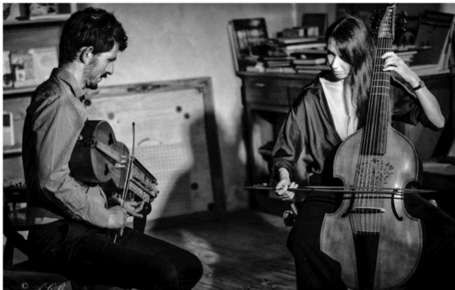
Le duo Tiggarna. Alain Le Bourdonnec

■ MUSIQUE. Salle Norbert-Le-Jeune et Espace culturel Ti Jean-Foucat. Contact: communication.hirustica@gmail.com , 06 95 12 06 39.